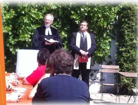
Ökumenischer Gottesdienst anlässlich der Hausweihe im Juni 2014