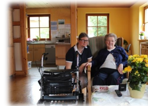
Einblick in die „Gute Stube“ der Wohngemeinschaft